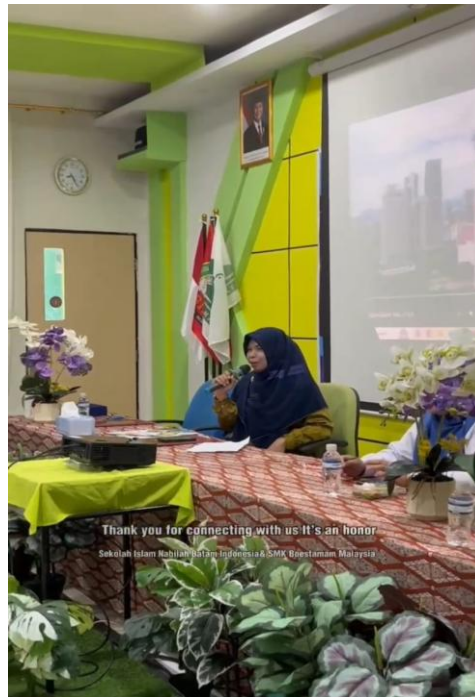
Gambar 4. Penyampaian materi ke dua