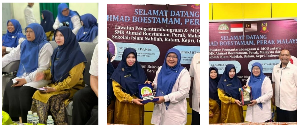
Gambar 5. Flyer dan Foto kegiatan PKM